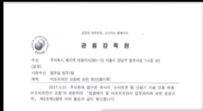
2017년 6월 21일 비조치의견서 발급 핀테크 기업 최초