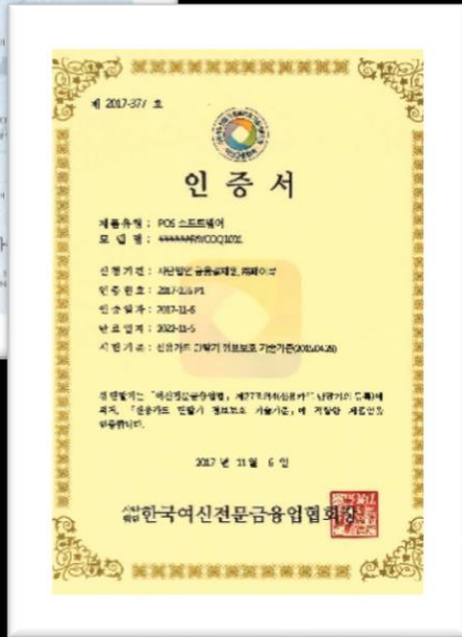
2017년 11월 6일 여신금융협회 인증서 획득