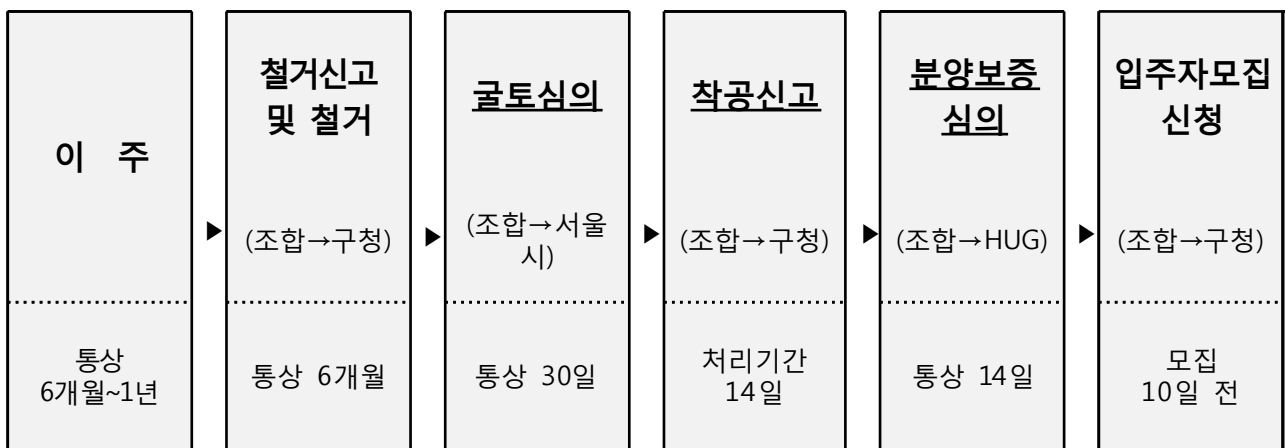
< 관리처분 이후 진행절차 >